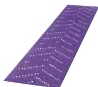
Абразивные Полоски 737U 3M™ Cubitron™ II