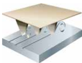
Зерно точной формы 3M