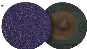
Зачистные Круги 3M™ Cubitron™ II Roloc™