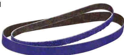
Шлифовальные Ленты 3M™ Cubitron™ II