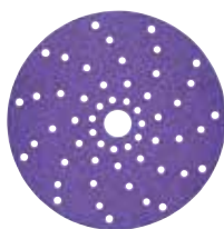
Абразивные Круги 737U 3M™ Cubitron™ II

Абразивы 3M™ Cubitron™ II равномерно прорезают материал, не перегревая поверхность. В процессе шлифовки происходит самозатачивание абразивных зерен, что обеспечивает постоянную агрессивность и более длительный срок службы.